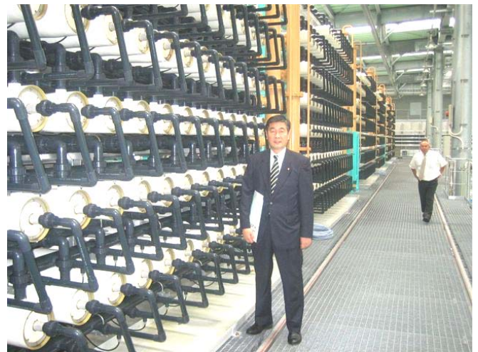
浸透膜の設置状況